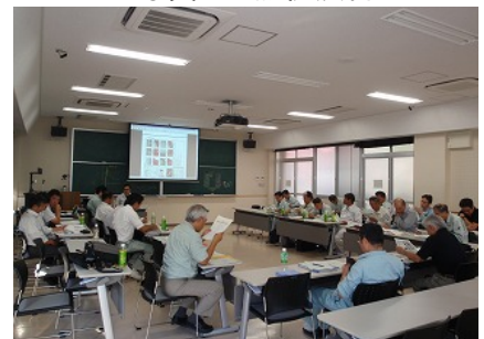
写真 3 プロジェクト演習