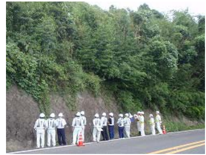
写真 1 点検実習

本養成ユニットの実施期間は、平成 20～24 年度となっているが、当センターとしては、本養成ユニット終了後も道守認定者に対して継続教育や更新講習等を実施し、道守認定者を全面的に支援する。