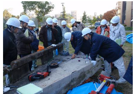
写真 2 点検演習